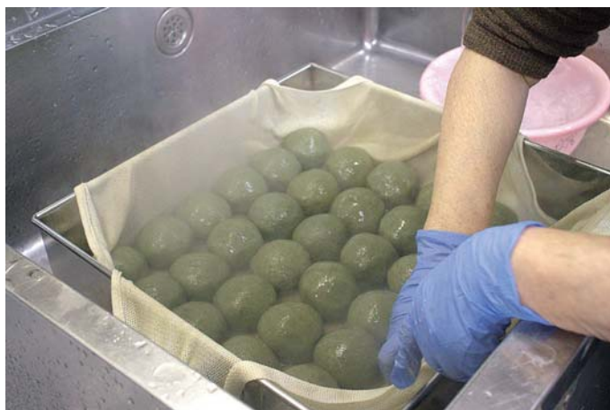
出来立ての彼岸団子