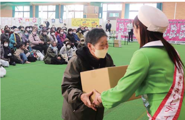
抽選会でスーパープレミアムを当選した来場者