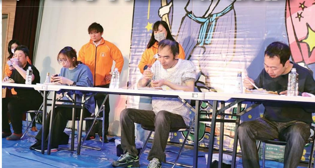
にんにく餃子早食い大会