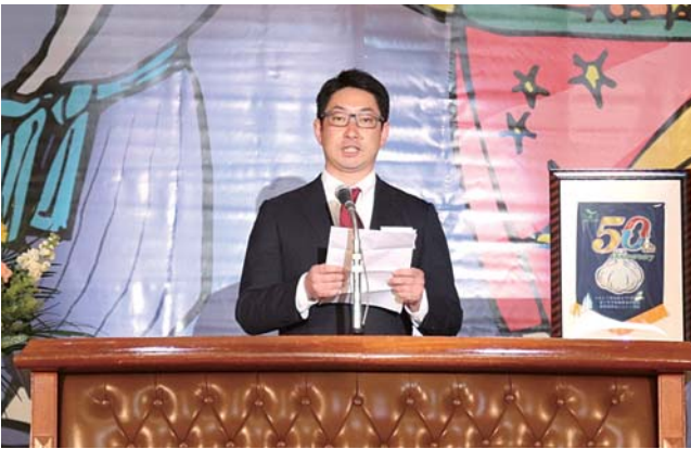
にんにく部会50周年記念式典にて甲地部会長のあいさつ