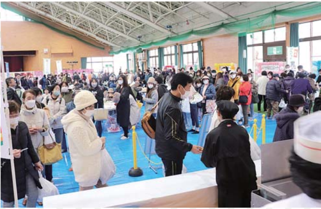
餃子に並ぶたくさんの来場者