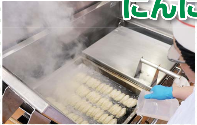
「餃子の王将」のにんにく激増し餃子