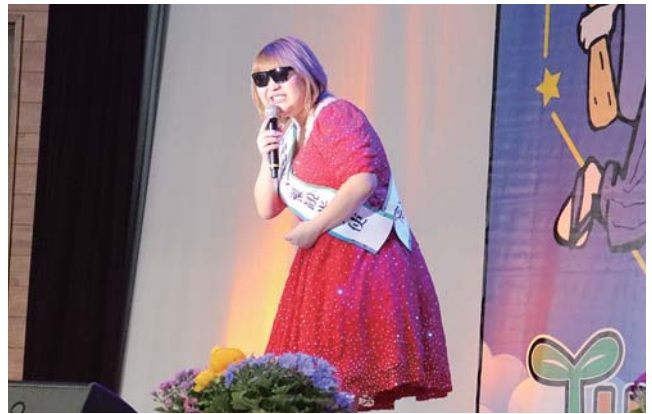
りんごちゃんによるお笑い歌謡ショー