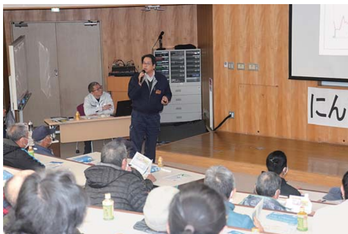
栽培講習会の様子

J A ゆうき青森野菜振興会にんにく部会は、東北町の原燃テクノロジーセンターでにんにく栽培講習会を開催した。