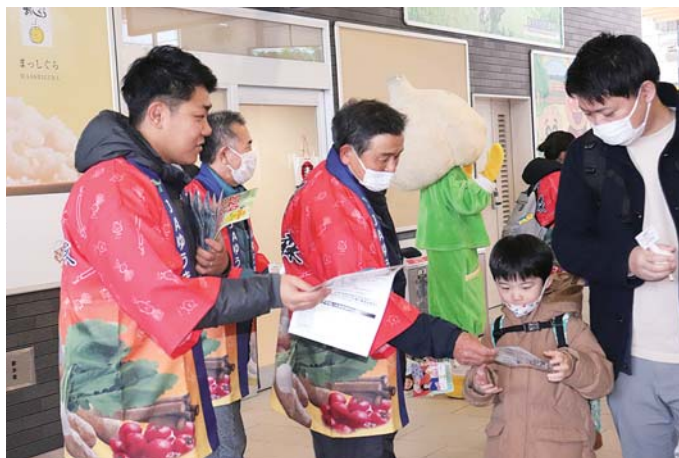
マイルドにんにくを配布する様子

J A ゆうき青森野菜振興会にんにく部会は、七戸十和田駅でマイルドにんにくを無料配布した。