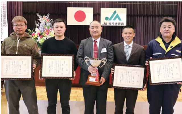
おいしいながいも決定戦の受賞者