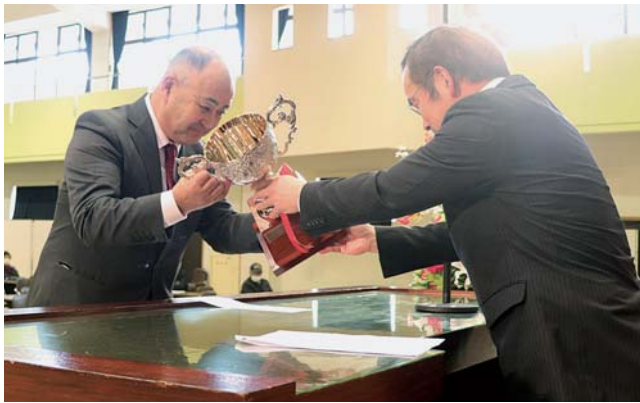
おいしいながいも決定戦の表彰式