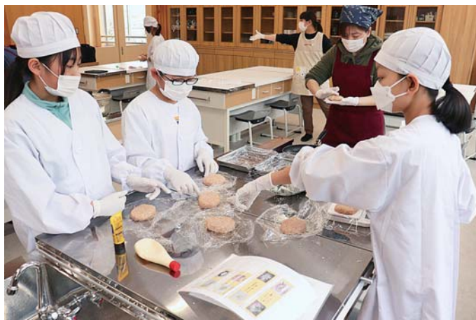
ハンバーグを作る児童ら

J A ゆうき青森は、六ヶ所村立千歳平小学校で調理実習を実施した。調理実習には、5年生の児童9名と食育ソムリエ5名が参加し、地元特産品の野菜を使い調理した。